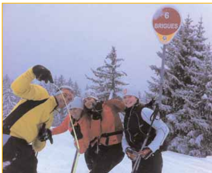
Forcément avec des skis de fond, la piste rouge de descente, ça l'a fait pas !!!