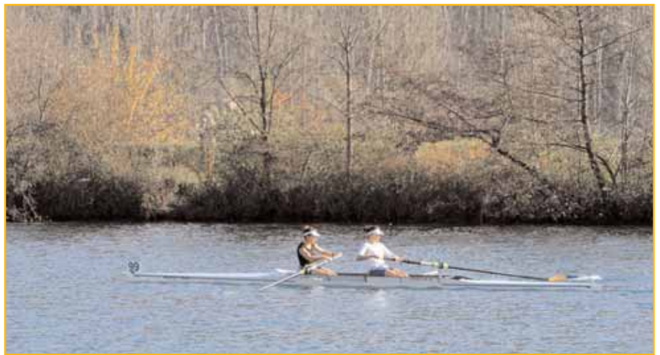
Le 2- SF montant au départ