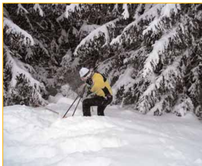
Xavier dans les sapins...