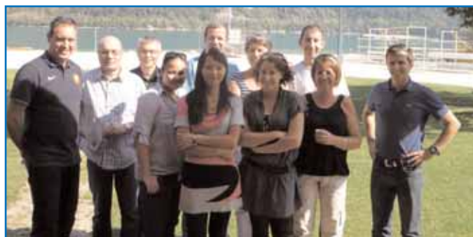
Les séminaristes ravis de leur journée passée sur la base départementale d'aviron