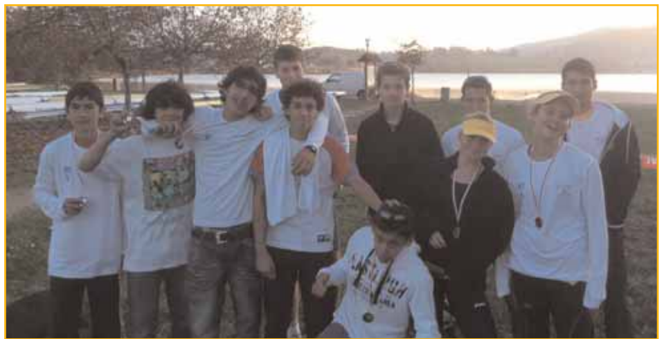
Le groupe cadettes et cadets du samedi