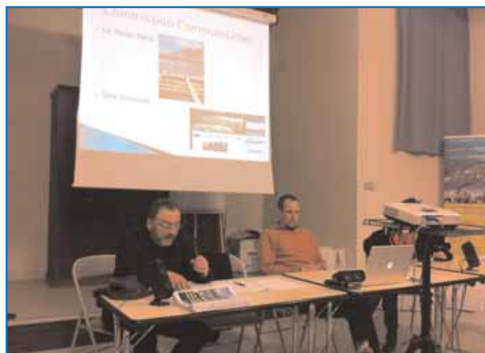
L'assemblée et le rapport des commissions