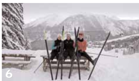
Stage de ski de fond à Courchevel