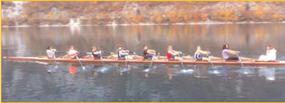
Les stagiaires à la découverte du huit