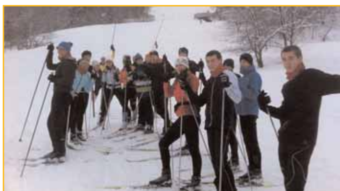
Le groupe de stagiaires