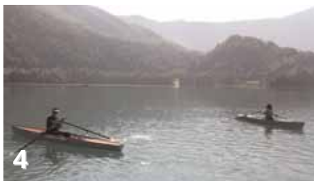
Journée portes ouvertes