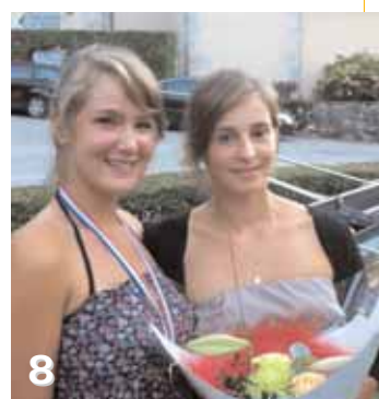
Réception Aiguebelette et Lépin-le-Lac